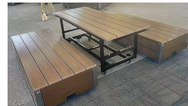
ご提案書 防府駅高架下憩いの広場／ステージ