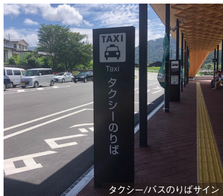
タクシー/バスのりばサイン