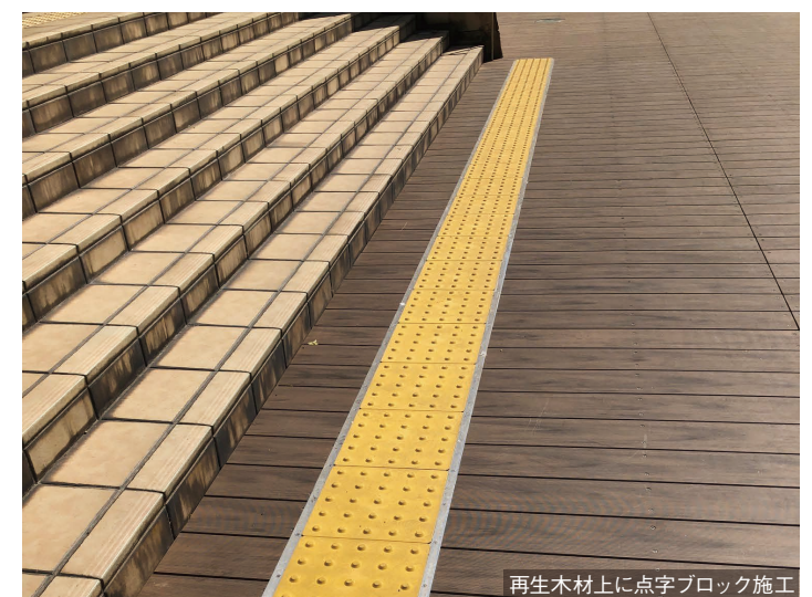
再生木材上に点字ブロック施工

木目調再生木材は1つとして同じ柄がないランダムな木目を施しているため、天然木と見間違ふほどの完成度で、自然な風合いを醸し出しています。色褪せにも強い再生木デッキは、長い間綺麗な公園の景観を保ち、来園される人たちに憩いを与えてくれるでしょう。