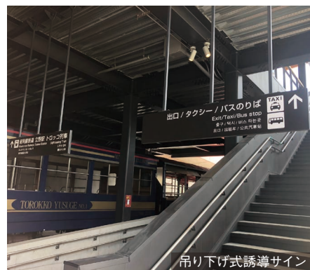
吊り下げ式誘導サイン