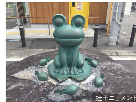
蛙のモニュメント

蛙のモニュメントは「草野心平」の作品中に出てくる「モリアオガエル」をイメージしており、地元の小川中学校美術部の生徒の皆様にデザインしていただきました。モニュメントには県道を通る皆様から「無事にカエル」、小川郷駅からきた皆様を「快くむカエル」という意味が込められております。