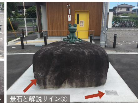
景石と解説サイン②

景石は平伏沼がある川内村産の御影石「滝根みかげ石」になります。モリアオガエルの繁殖地として、国の天然記念物に指定されています。