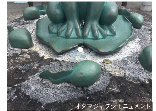
オタマジャクシモニュメント

金額: ¥320,000/基(材のみ) 仕様: マグネティックボード 寸法: W1854×H1905