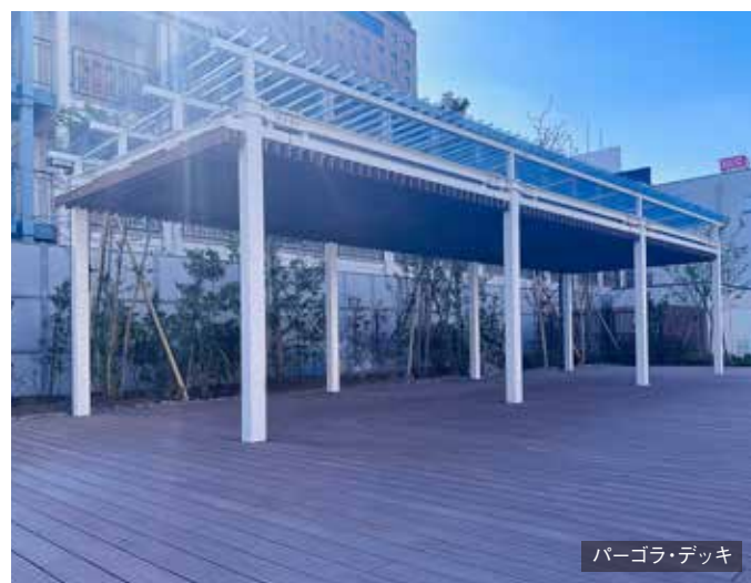
パーゴラ・デッキ