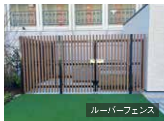
ルーバーフェンス