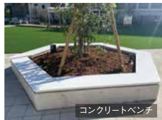
コンクリートベンチ