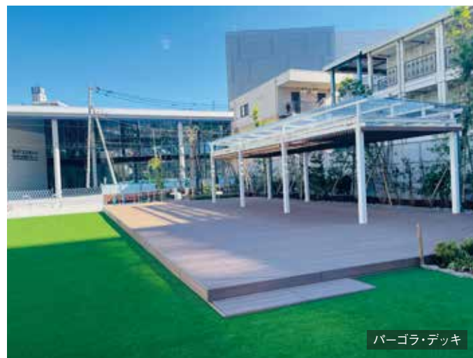
パーゴラ・デッキ

隣接する東京たま未来メッセでも様々なイベントがおこなわれているので併せてみるのもいいかもしれません。