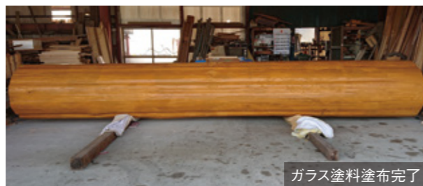
ガラス塗料塗布完了

皮を剥いてみると広範囲に虫食いが発生していたことが判明。この虫食い跡を削ぎ落とすのか、計画を断念するのか、協議がなされ、その結果、可能な限り虫食い跡を削ぎ落とし、目立たないように着色するということになりました。