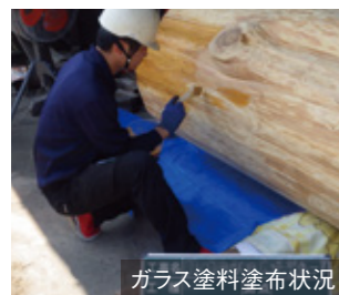
ガラス塗料塗布状況

原木は、地元日田木材協同組合に保管されていたもの。まだ皮がついたままの状態、長さ6.2m、径82cmの巨木でした。